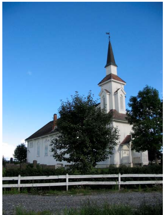
Tyristrand kirke (2005)