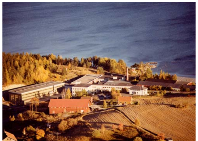
Slik ser bedriften ut i dag fra luften mot Tyrifjorden.