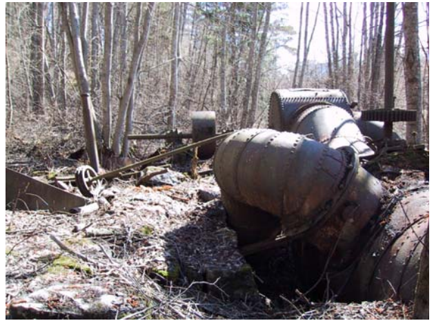
Jernbanebroen ved Skjærdalens Brug er bygget opp av stein på en spesiell måte